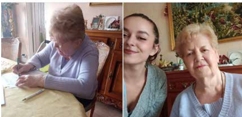
Cet hiver, suite à l'appel à correspondance posté sur les réseaux par une résidente d'un Ehpad de Nantes, les seniors accueillis dans les structures municipales ont pris la plume pour lui répondre, là encore avec le soutien de jeunes qui ont choisi de donner un peu de leur temps pour accompagner leurs aînés. Une aventure partagée sur la page Facebook de la Ville

La maison des seniors ouvrira ses portes à l'angle des rues Gabriel-Péri et des petites-maisons. Destinée à créer un lieu d'accueil unique pour la plupart des demandes liées à l'avancée en âge, elle sera un espace ressources pour les seniors, leurs proches, les aidants et les professionnels.